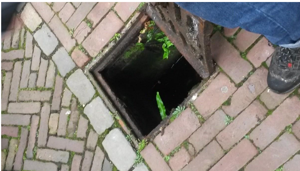
Afbeelding 4: Tongvaren in straatput

Met het vaststellen van de Utrechtse soortenlijst blijven we in beheer en onderhoud rekening houden met beschermde en beleidssoorten conform de richtlijnen van de leidraad horende bij de gedragscode (zie raadsbrief Gedragscode wet Natuurbeheer d.d. 17 november 2017). Dit is passend binnen het huidige beheerbudget. De soorten uit de Utrechtse soortenlijst worden hiertoe opgenomen in de gedragscode (in tabel 2 van de 'Leidraad voor het zorgvuldig handelen bij beheer en onderhoud in de gemeente Utrecht').