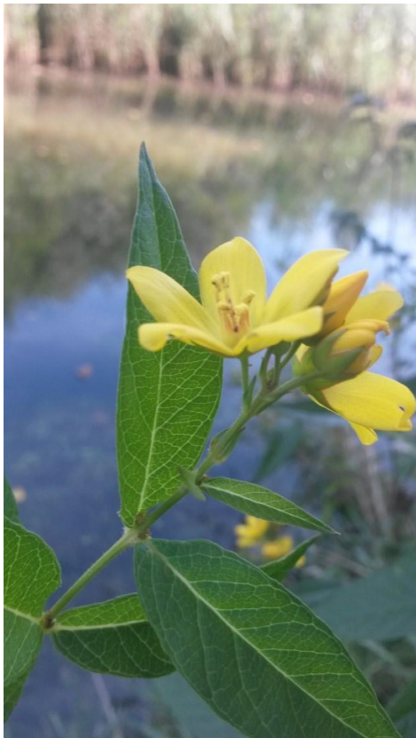
Afbeelding 5: Grote wederik