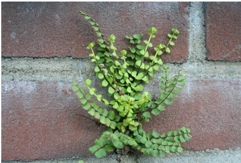
Afbeelding 1: Steenbreekvaren in de muur bij de Nieuwe kade

De Wet natuurbescherming gaat te zijner tijd op in de Omgevingswet. Met het vaststellen van deze nota gaat de Utrechtse soortenlijst alvast op in de Omgevingsvisie Utrecht. Ook betekent het dat bij gemeentelijke plannen de Utrechtse soortenlijst gaat gelden. Een uitzondering wordt gemaakt voor plannen waarbij onderzoeken al zijn afgerond of nog lopen. 2