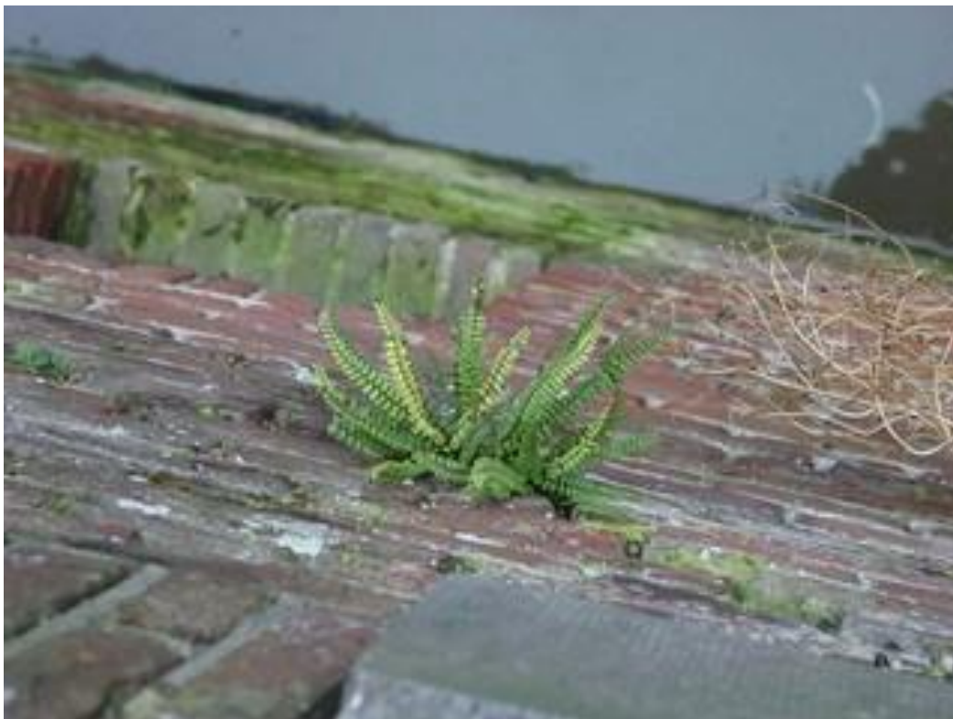
Steenbreekvaren op grachtmuur

Uitwerking Groenstructuurplan t.b.v. Utrechtse soorten