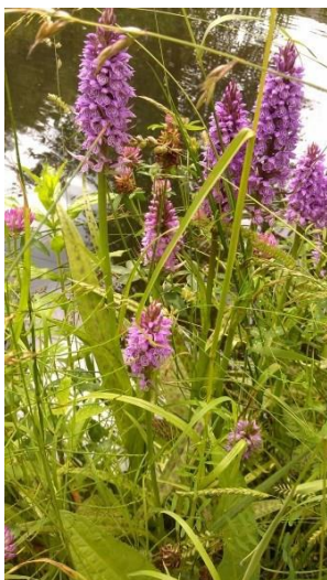
Afbeelding 2: Rietorchis

In Utrecht komen daarnaast 95 planten en dieren voor die onder de Wet natuurbescherming beschermd zijn. Deze zijn in bijlage 2 (tabel 4), weergegeven zodat het totaaloverzicht van in Utrecht beschermde of beleidsmatig relevante soorten in één document te vinden is. Van deze 95 beschermde soorten zijn 22 soorten door middel van een provinciale verordening vrijgesteld van de Wet natuurbescherming. Ook voor deze soorten blijven we ons inspannen bij inrichting en beheer van onze stad.