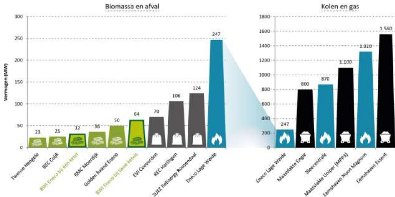
Figuur 2: BWI ten opzichte van andere centrales 13

Door de BWI te vergelijken met andere nieuwe centrales in Nederland, kan een gevoel worden gekregen hoe groot de centrale wordt en welke (potentiële) invloed dat heeft op de emissies en luchtkwaliteit. We kijken hierbij naar kolen-, gas-, afval- en biomassacentrales, zie figuur 2.